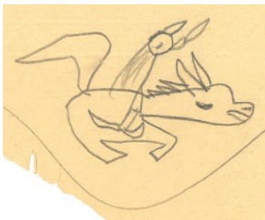
Senza titolo (cavaliere a cavallo), 1959, matita su carta, Collezione privata