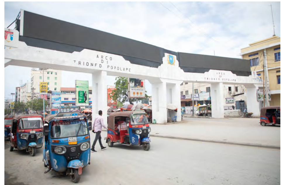
Arco di Trionfo Popolare, Mogadiscio / Mogadishu, 2024