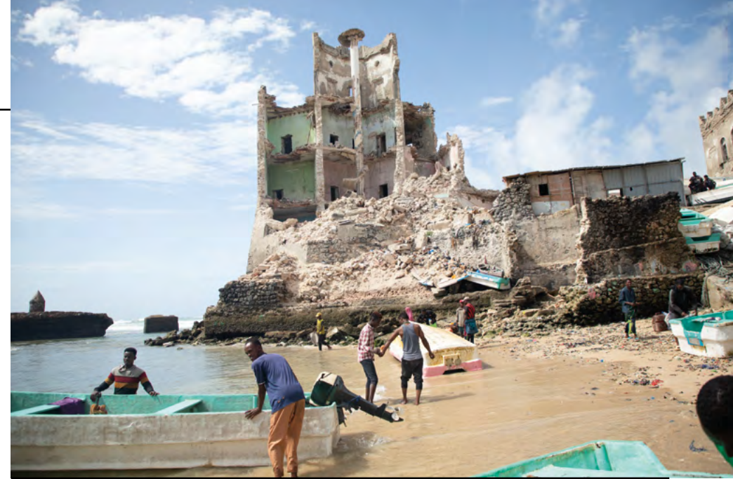
Faro di Mogadiscio / Lighthouse of Mogadishu, 2024

In Somalia, the long civil war has left deep wounds in the city of Mogadishu, but buildings and neighborhoods are still visible that tell the story of the fusion of multiple cultures and identities. Today, however, this heritage is once again put at risk by careless building operations, also favored by the lack of awareness of the value of the ancient nuclei and the works of the Italian period. To counteract this process, for years Somali and Italian scholars have been documenting, researching and recounting the city's historical architecture in contemporary terms, so that a future consciousness is built on the traces of the past. The current image of Mogadishu emerges in the exhibition through the fleeting shots of the photojournalist and journalist Farah Omar Nur, which show what remains of the historic buildings, and from the images and sounds of the videos collected by the Somali Architecture group, testimonies torn from the precarious daily context in which the city lives whose content necessarily prevails over aesthetics.