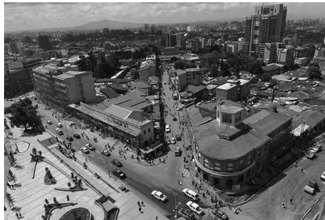
Vista aerea del quartiere Piazza, Addis Abeba / Aerial view of the Piazza neighbourhood, Addis Ababa, 2024

In Ethiopia, an extremely rapid urban transformation process is taking place, especially in the capital. MAXXI has entrusted Ethiopian photographer Michael Tsegaye with the task of documenting this sudden process of modernisation in the cities of Addis Ababa and Jimma, where the demolition of entire buildings or historic neighbourhoods is resulting not only in the loss of historic architectural heritage, but in an even more serious and impactful disintegration of the social fabric. The voices of scholars, artists and architects bear witness to a spontaneous process of cultural appropriation that serves as a means of resistance to an urban transformation process that is insensitive to the historical identity of cities and the communities that inhabit them. The neighbourhoods and urban projects of Italians are thus reabsorbed within a conception that considers them - together with other pre-existing elements - as a form of resistance to the indiscriminate erasure of the past in favour of alleged, faceless modernisation.