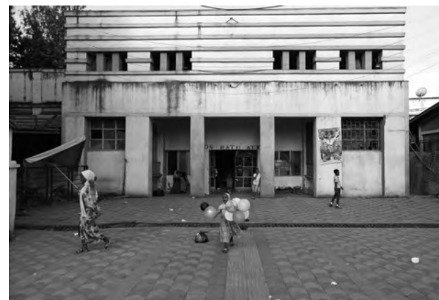
Facciata del Cinema Roma a Jimma / Facade of the Roma Cinema in Jimma, 2024