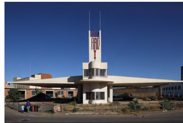
Stazione di servizio / Service Station Fiat Tagliero, Asmara