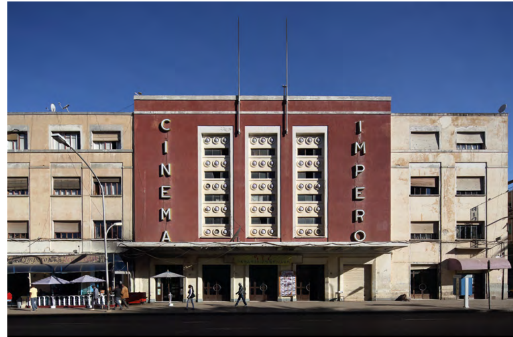
Cinema Impero, Asmara

In Eritrea, and especially in the city of Asmara, which has been declared a UNESCO World Heritage Site by virtue of its being a modernist African city, the overlapping of identities makes the very close relationship between the past, present and future of the Italian architectural heritage extremely tangible. Indeed, the buildings constructed by the colonisers have seamlessly become symbolic places, thus turning into bearers of memory for the colonised – who have managed to prevent city from undergoing indiscriminate transformations through its inclusion in the UNESCO World Heritage List. Clearly, this peculiar condition not only guarantees the preservation of the historical built heritage, but also fuels virtuous projects aimed at its enhancement. As can be seen from the materials on display, buildings and urban spaces have remained substantially unchanged over the course of about a century. Particularly noteworthy is the FIAT Tagliero service station, a markedly futurist building.